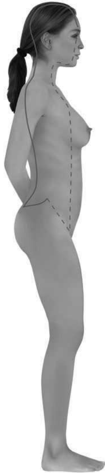
Παράδοξος Μεσημβρινός Du Mai (Κυβερνητικό Αγγείο-Κ.Α.)